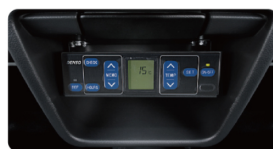
2 冷凍機コントローラー移設