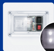
庫内灯&非常ブザー