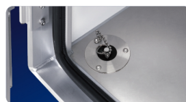
3 水抜き穴追加(左後)