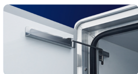
1 90度ストッパー(左側)