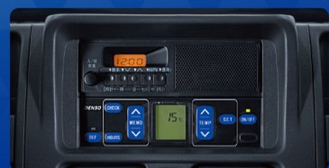
冷凍機コントローラー