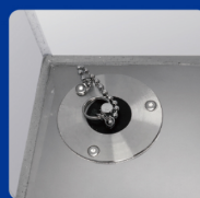
水抜き穴栓付(左前)