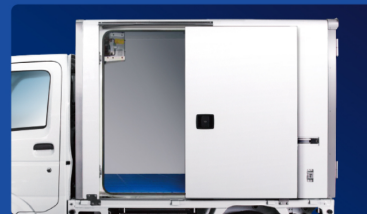
2 ワンタッチ式 左片側スライドドア