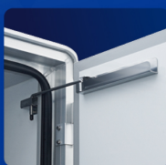
90度ストッパー(右側)