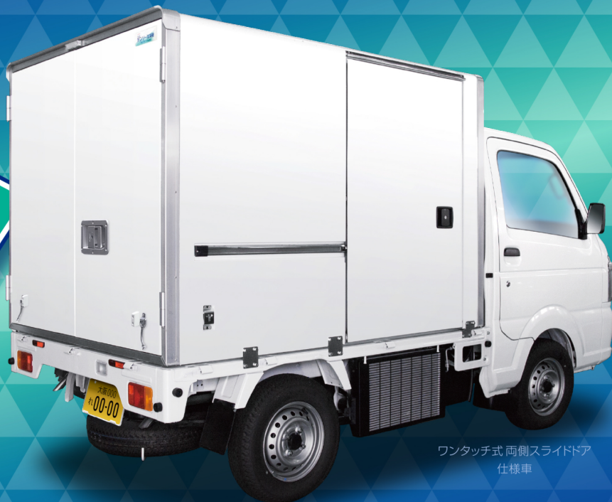
ワンタッチ式 両側スライドドア 仕様車